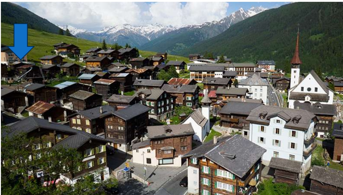
Münster aus der Luft (Blau = Standort Stall)