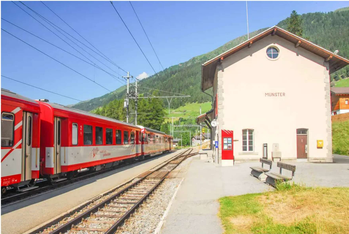
Bahnhof von Münster