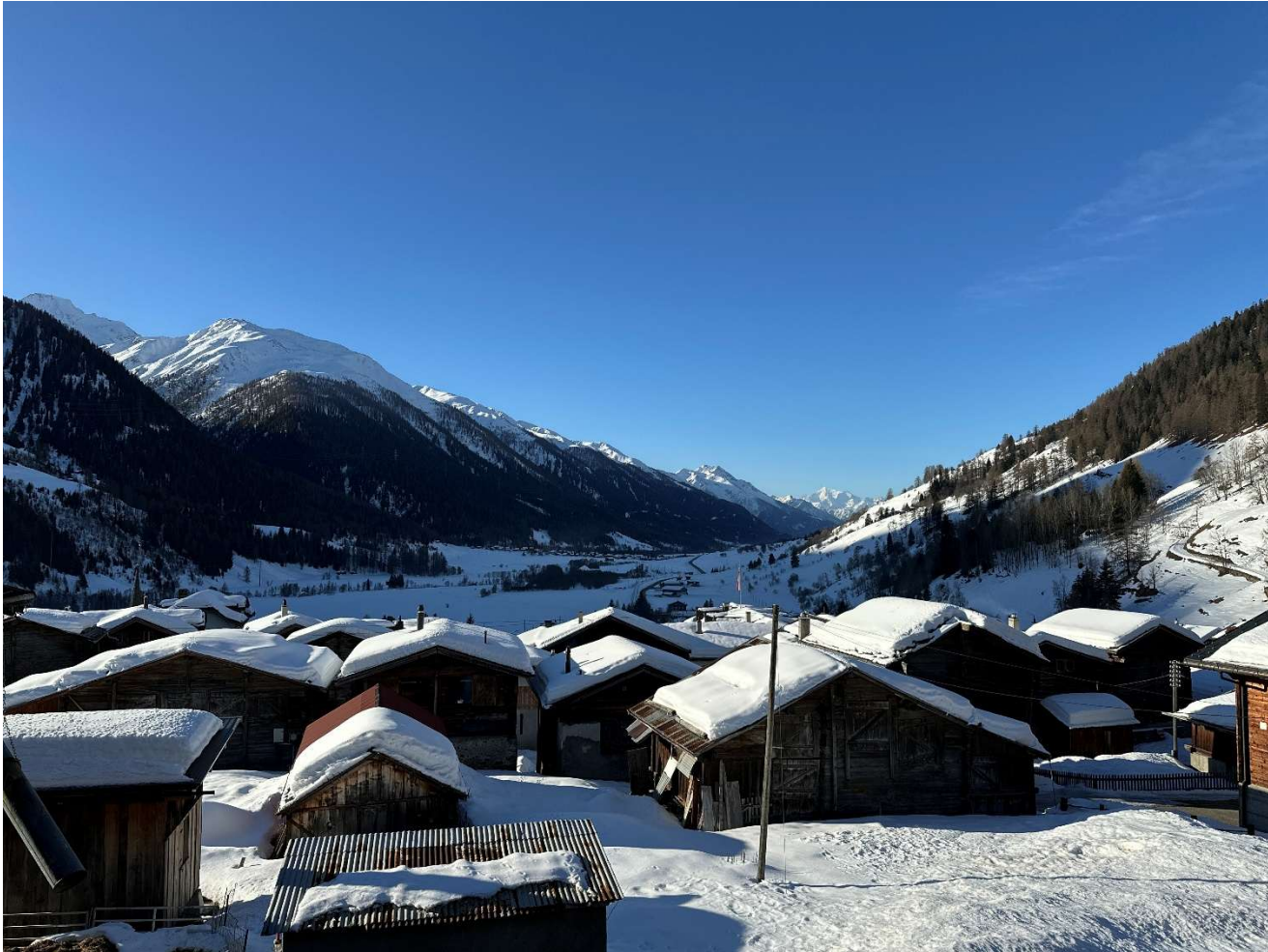
Ausblick Tal DG