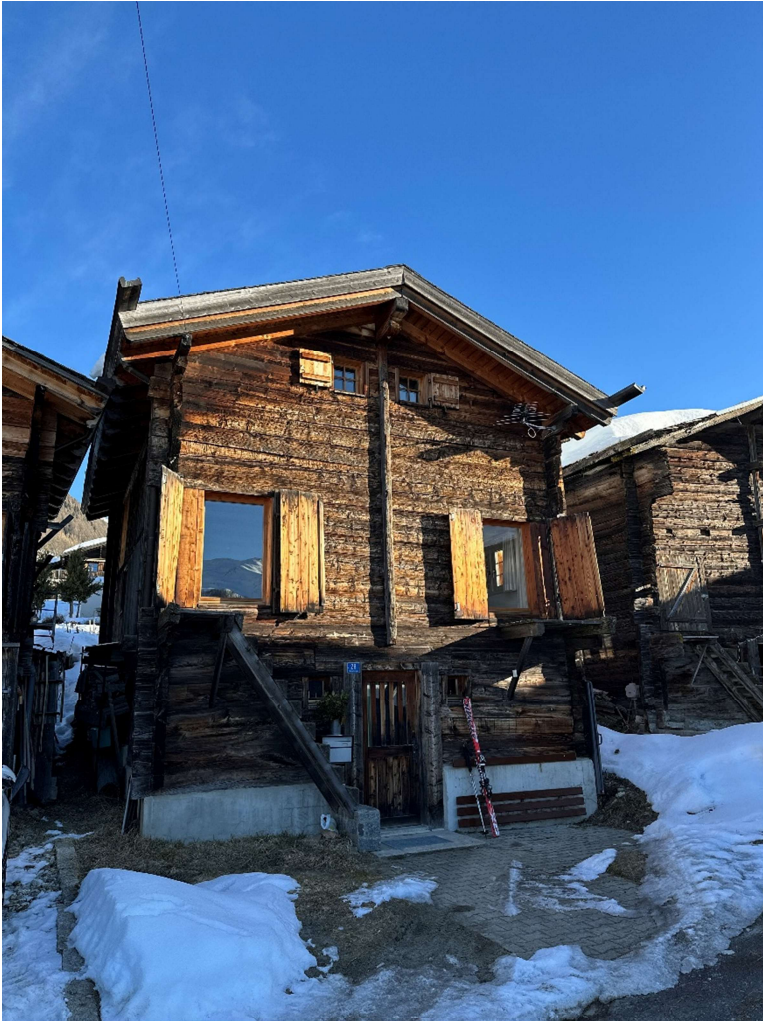
Ansicht Westfassade im Winter