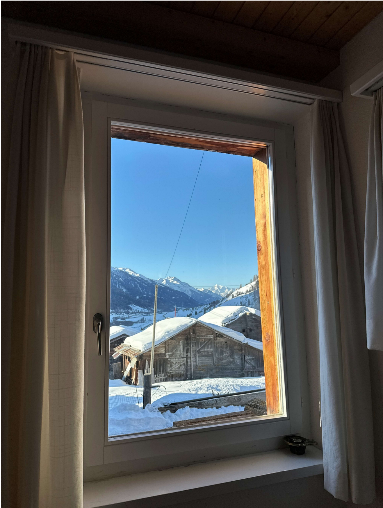
Ausblick Weisshorn OG