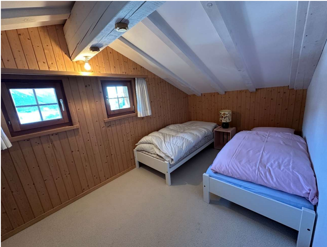
Schlafzimmer 2 DG