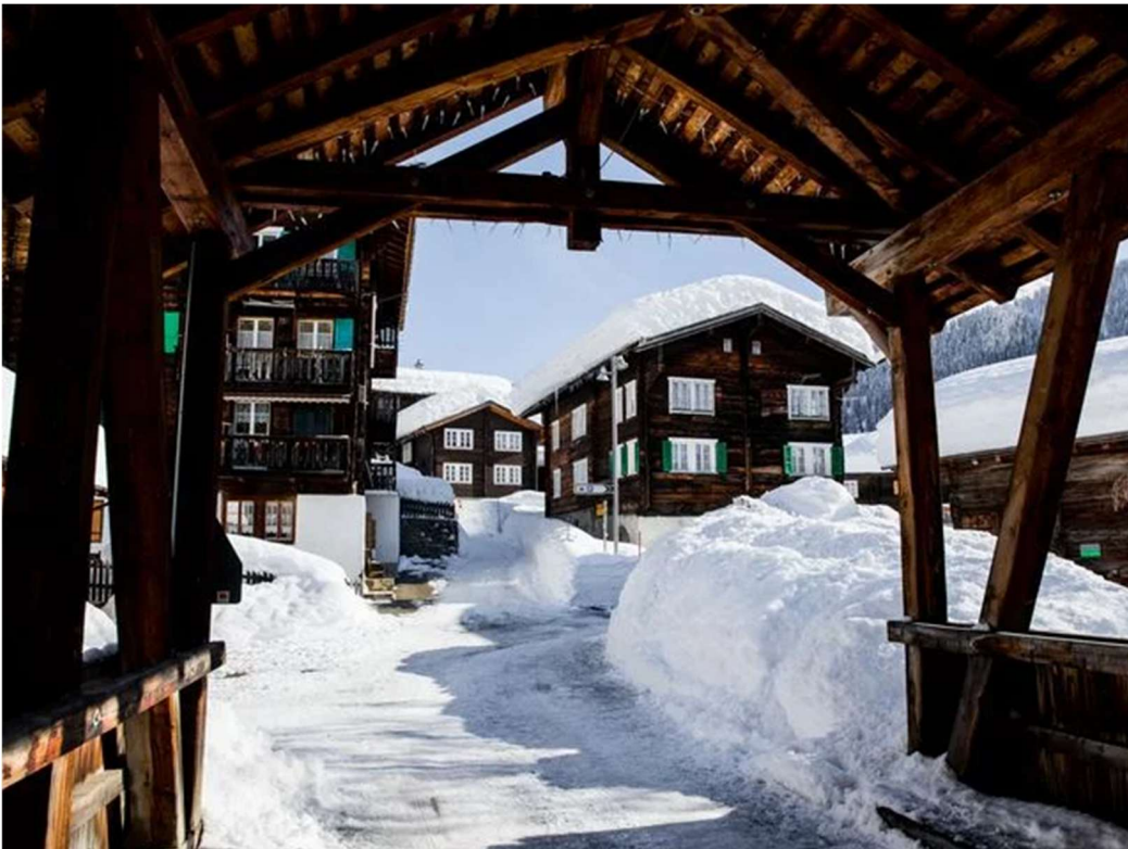
Hinterdorf im Winter