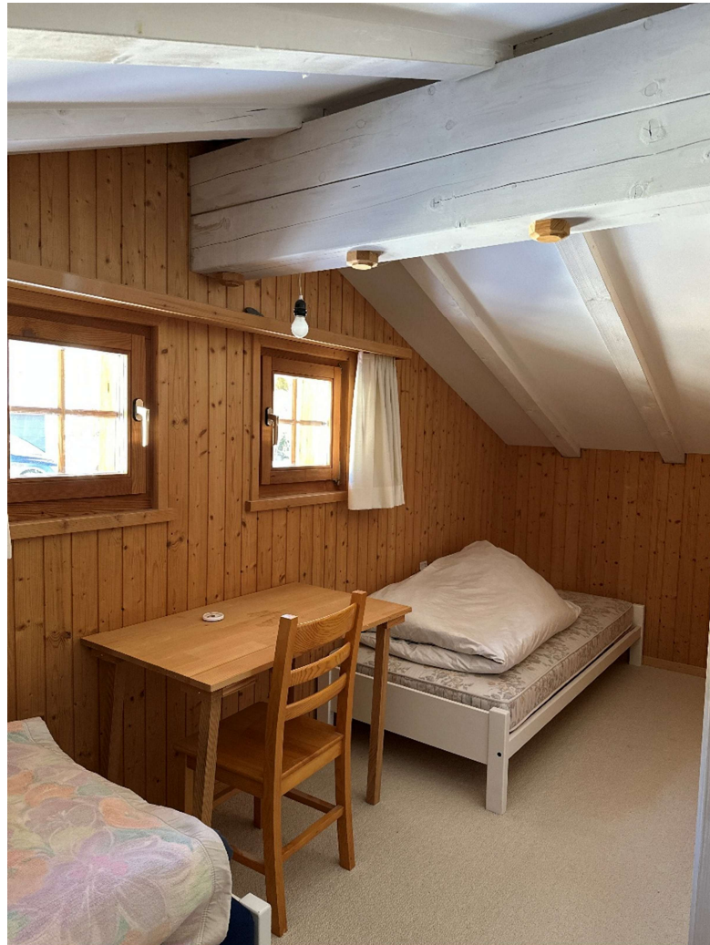
Schlafzimmer 1 DG